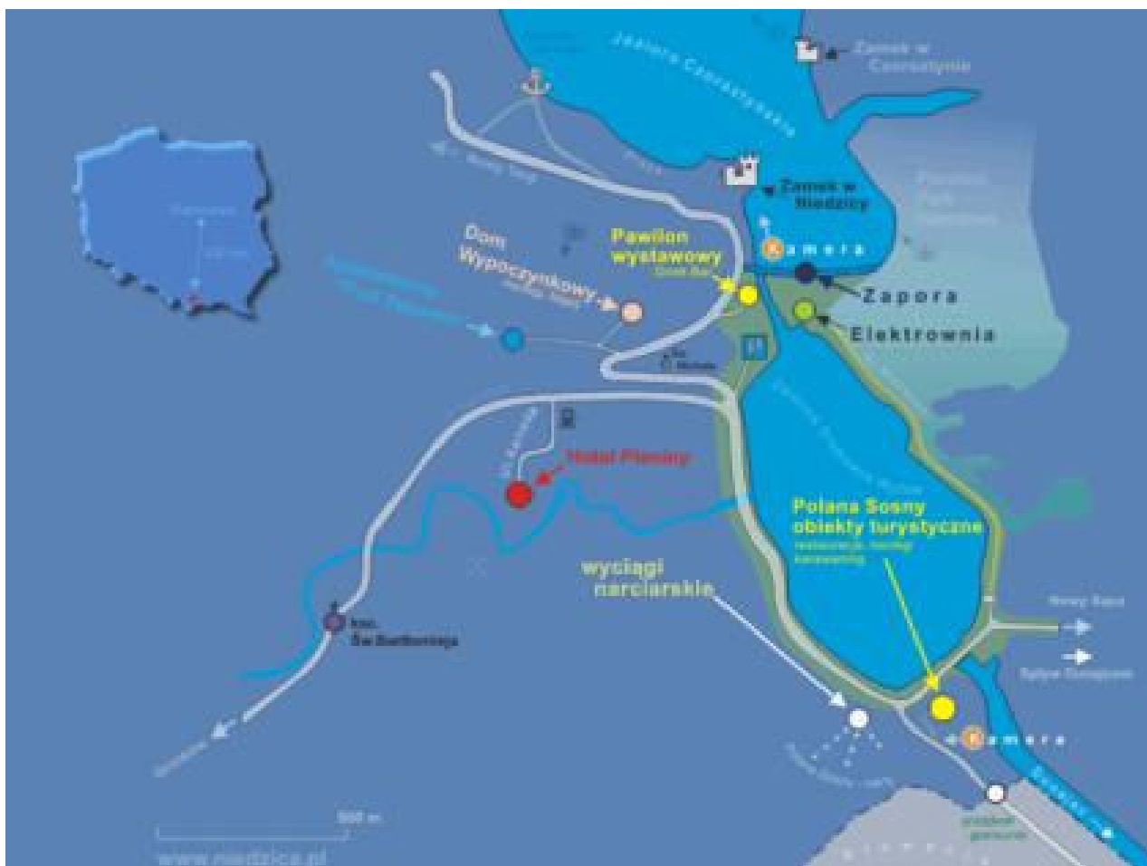
Widok i rozmieszczenie obiektów Zespołu Elektrowni Wodnych w Niedzicy

34-400 Nowy Targ, ul. Kolejowa 99, tel. 694 075 689, e-mail ks.wiaterni@gmail.com